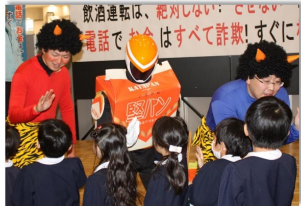
園児たちとのハイタッチ！