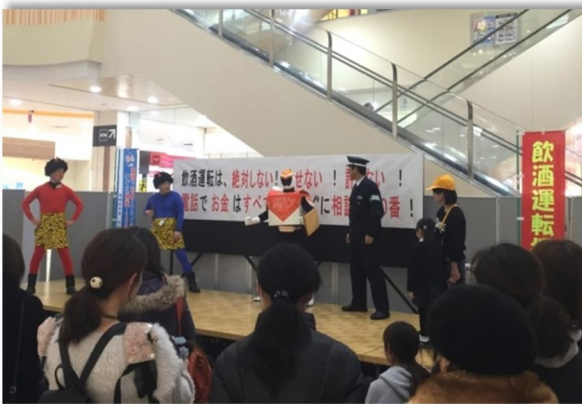
堅パンマン ステージに登場

イベント終了後は八幡の町が明るく安全・安心であり続けるよう、来場者へ堅パンを配布し、飲酒運転撲滅とニセ電話詐欺防止を呼びかけました。